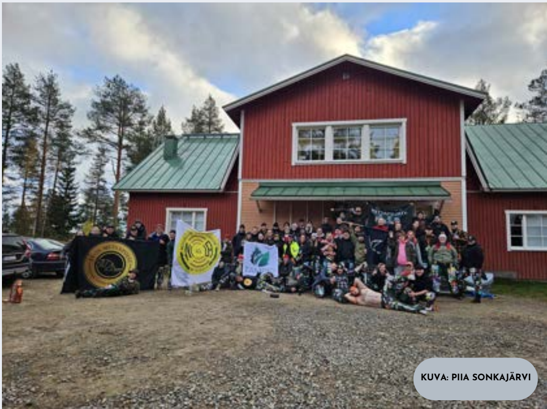
KUVA: PIIA SONKAJÄRVI